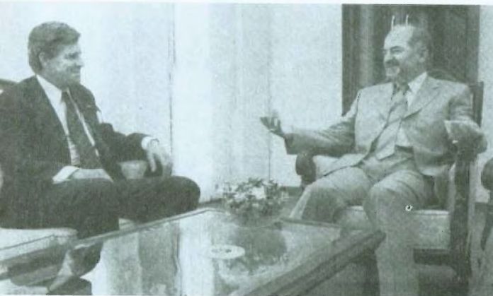
اجتماع مع نائب الرئيس إبراهيم الجعفري، حزيران/يونيو 2004